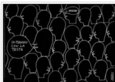
Fuorisalone 2014 – Superstudio Più – Tovaglietta Superstudio, Io mangio con la testa by Laura Zeni

ARCHIVIATO IN MAPPA FUORISALONE 2014, PIATTI FUORISALONE, PIATTI LAURA ZENI, TOVAGLIETTE LAURA ZENI