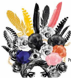
Poster Fair Hair I Swear, Studio Lisa Bengtsson (€ 20,50 ca).