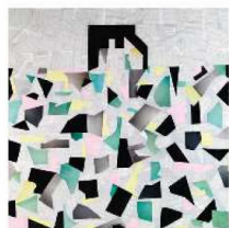
Acrilico e collage su tela, Omaggio a Living, serie Geometrie ri-viste, 2016, Laura Zeni (€ 2.000, esposto al Jvstore di Jannelli&Volpi, Wallpaper Interiors).

Appendi alle pareti quadri di giovani artisti. Dove cercarli? Vai alla MIA Photo Fair, fiera d'arte dedicata alla Fotografia e all'Immagine in Movimento (a Milano, 10-13 marzo 2017) e visita il suo shop ( www.miafair.it/milano/collection-mia ).