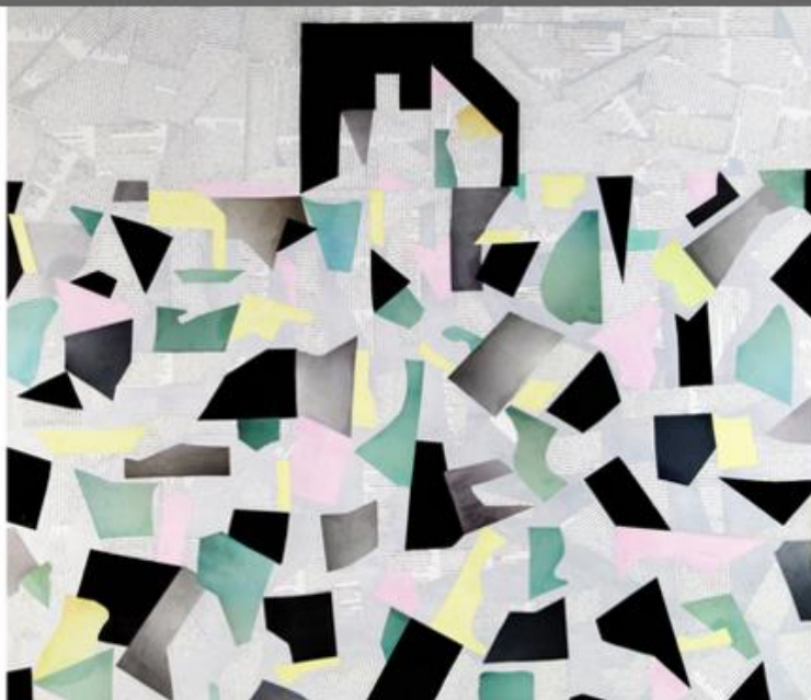
3 / 7 Laura Zeni, omaggio a Living