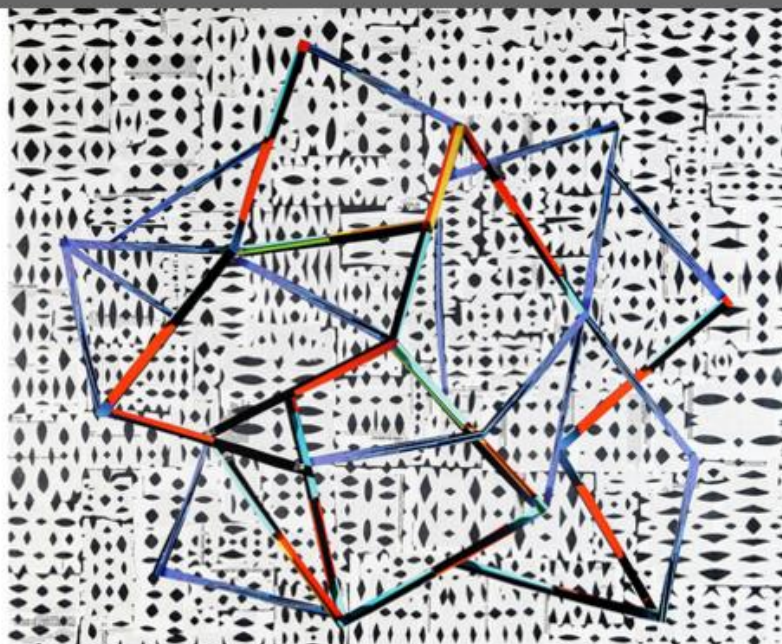
4 / 7 Laura Zeni, omaggio a Interni